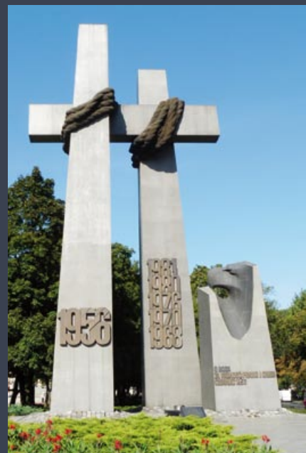
Pomnik w roku 2009.

Najpierw podczas remontu w 1991 roku dołączono datę „1981”, a przed 50. rocznicą wydarzeń czerwcowych w 2006 roku, podczas renowacji, do napisu na pomniku dodano wezwanie „O Boga”. Natomiast przed monumentem, tuż za marmurowym znaczem, dostawiono tablicę upamiętniającą modlitwę Jana Pawła II, a później, na szczycie z boku, tablicę o prezydentach itd. Zaczęła się cepelia.