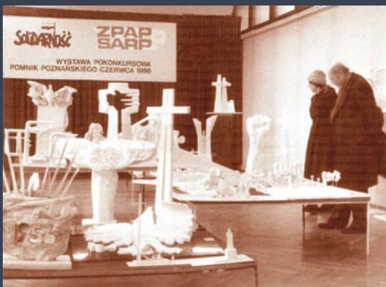
Archiwalne zdjęcie. Wystawa pokonkursowa 1981.

W kolejnych latach zaczęto dodawać elementy do pomnika i wokół niego.