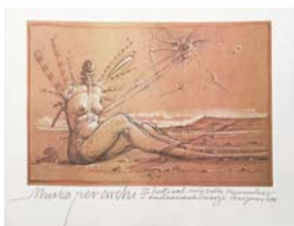
Musica per archi, plakat, 1984

noczesność życia i śmierci. Obsesja przemijania, erotyzm spleciony ze śmiercią, silne poczucie nadrealności i nadzwyczajne umiejętności sprawiały, że pod ręką artysty powstawały dzieła niezwykle. Dotykają tajemnicy, wyzwalają u odbiorcy nieznanne wcześniej przeżycia duchowe. ■